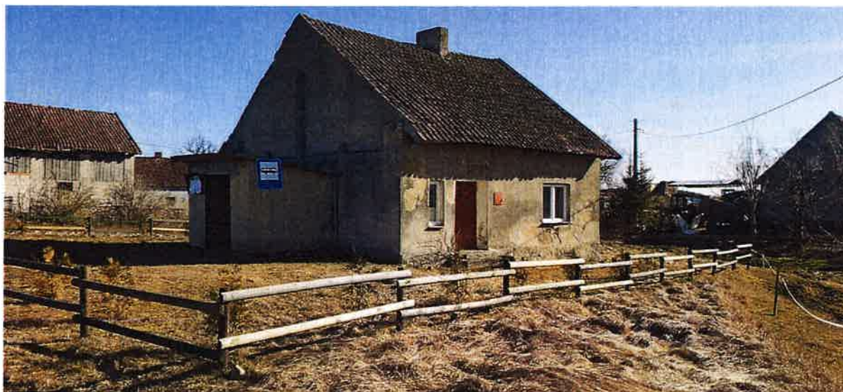
Rys. 7 Budynek świetlicy wiejskiej w Połapinie

Na terenie sołectwa Połapin nie działa żadne Stowarzyszenie.