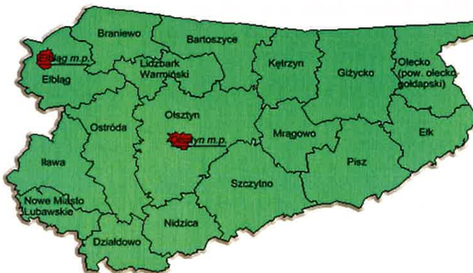
Rys.2 Usytuowanie powiatu lidzbarskiego na tle województwa warmińsko-mazurskiego

Gmina Kiwity położona jest w północno-wschodniej części Polski, w północnej części województwa warmińsko-mazurskiego. Pod względem fizyczno geograficznym obszar gminy Kiwity położony jest na prekambryjskiej platformie wschodnioeuropejskiej w prowincji Nizu Wschodniobałtycko - Białoruskiego w jednostce tektonicznej zwanej syneklizą perybałtycką. Przez obszar gminy przebiega granica dwóch mezoregionów