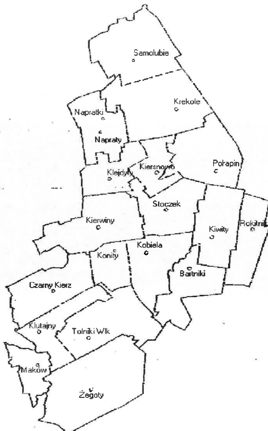
Rys. 5 Położenie sołectwa Połapin na tle innych sołectw gminy Kivity.

Pod względem fizyczno geograficznym obszar gminy Kivity, w tym sołectwa Połapin położony jest na prekambryjskiej platformie wschodnioeuropejskiej w prowincji Nizu