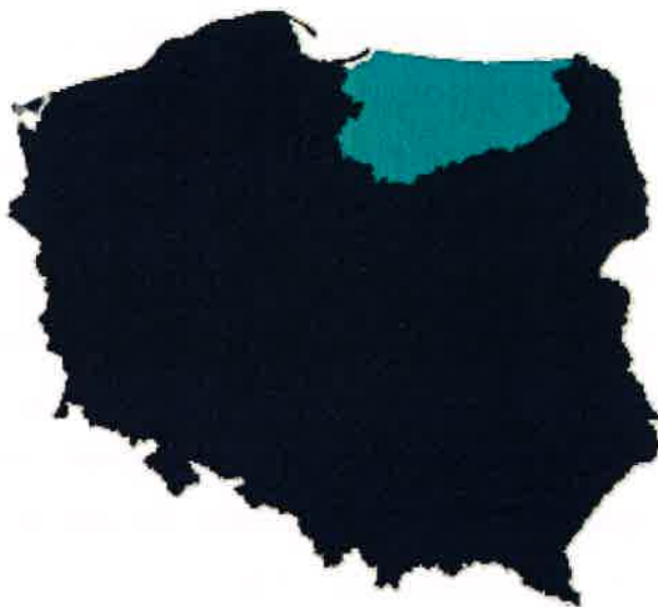
Rys.1 Usytuowanie województwa warmińsko-mazurskiego na tle kraju

Plan Odnowy Miejscowości Połapin na lata 2022-2028 obejmuje swym zasięgiem miejscowość Połapin położoną na terenie Gminy Kiwity, w powiecie lidzbarskim, w województwie warmińsko-mazurskim.