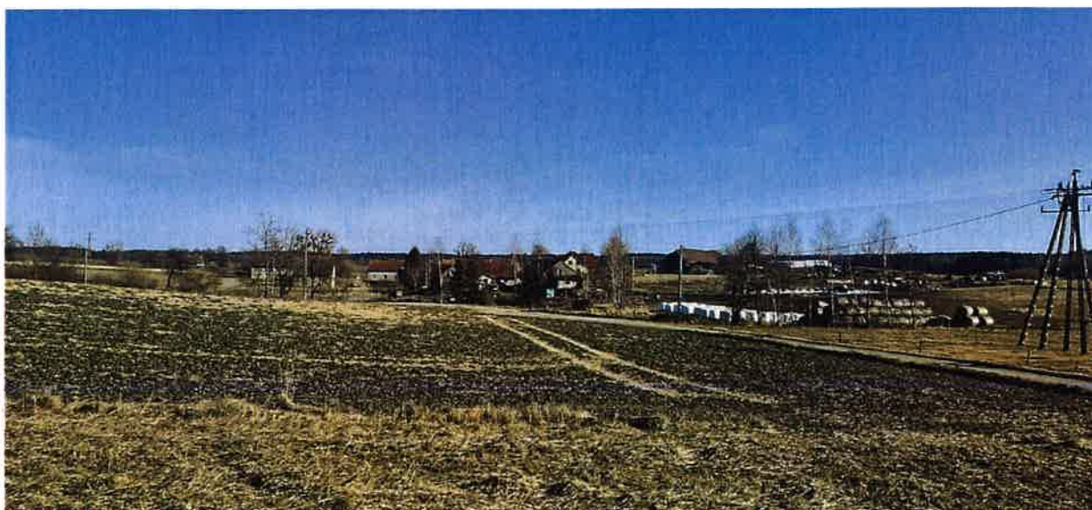
Rys. 6 Panorama miejscowości Połapin

Dominującą przestrzennie jednostką geomorfologiczną, kształtującą krajobraz gminy jest wysoczyzna morenowa o urozmaiconej, na ogół falistej do pagórkowatej rzeźbie.