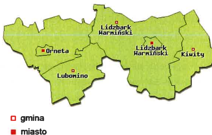
Rys. 3 Gmina Kiwity na tle Powiatu Lidzbarskiego źródło: www.zpp.pl

Powierzchnia terenu obniża się w kierunku północnym. Rzędne powierzchni terenu wynoszą od ok. 80 m n.p.m. w rejonie Samolubia, do 153,6 m n.p.m. w rejonie Bartnik.