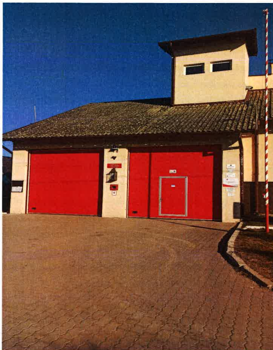
Rys. 9 Remiza Ochotniczej Straży Pożarnej w Kiwitach

ochronie przeciwpożarowej. Jednostka OSP Kiwity posiada dobre warunki lokalowe, mieści się w remizie strażackiej z siedziba Kiwity 75, w której znajdują się boksy garażowe wraz z zapleczem socjalnym. Jednostka OSP Kiwity funkcjonuje w Krajowym Systemie Ratowniczo-Gaśniczym. Dysponuje 3 samochodami: marki RENAULT D16 rok produkcji 2019 i marki JELCZ r. produkcji 1991 i Volkswagen T4 r. produkcji 2002 otrzymany w 2020 roku z KW Policji. Natomiast samochód Jelcz jest mocno wyeksploatowany i nie spełnia już wymagań zarówno strażaków ochotników jak i norm stawianych przez Krajowy System Ratowniczo-Gaśniczy