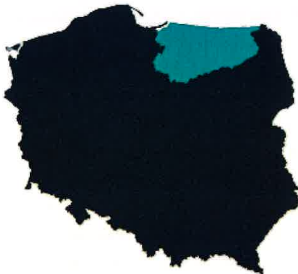
Rys.1 Usytuowanie województwa warmińsko-mazurskiego na tle kraju

Plan Odnowy Miejscowości Kiwity na lata 2022-2028 obejmuje swym zasięgiem miejscowość Kiwity położoną na terenie Gminy Kiwity, w powiecie lidzbarskim, w województwie warmińsko-mazurskim.