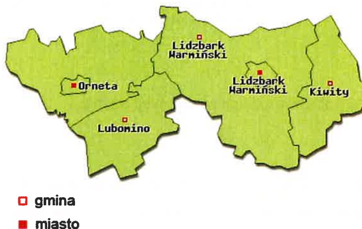
Rys. 3 Gmina Kiwity na tle Powiatu Lidzbarskiego

Powierzchnia terenu obniża się w kierunku północnym. Rzędne powierzchni terenu wynoszą od ok. 80 m n.p.m. w rejonie Samolubia, do 153,6 m n.p.m. w rejonie Bartnik.