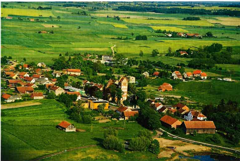
Rys. 6 Panorama miejscowości Kiwity z lotu ptaka

Dominującą przestrzennie jednostką geomorfologiczną, kształtującą krajobraz gminy jest wysoczyzna morenowa o urozmaiconej, na ogół falistej do pagórkowatej rzeźbie.