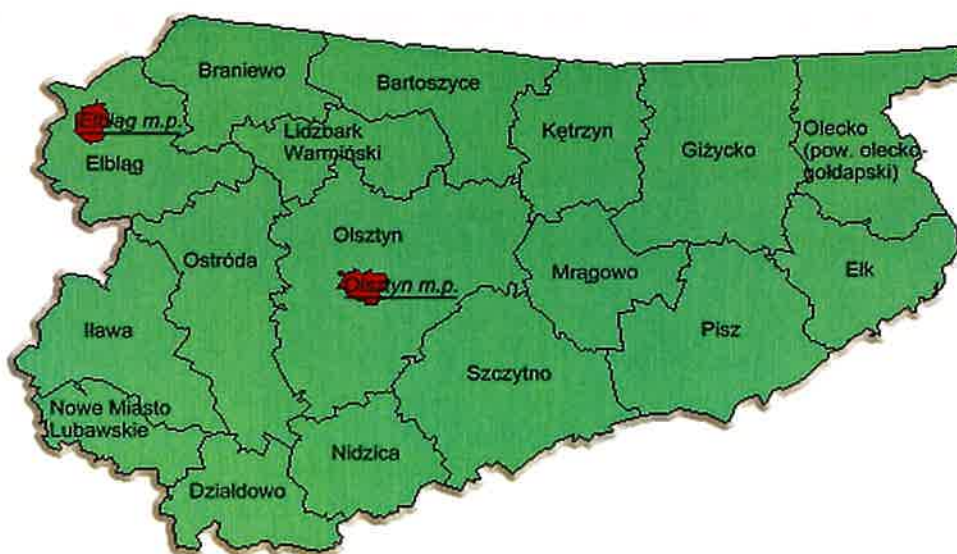
Rys.2 Usytuowanie powiatu lidzbarskiego na tle województwa warmińsko-mazurskiego

Gmina Kiwity położona jest w północno-wschodniej części Polski, w północnej części województwa warmińsko-mazurskiego. Pod względem fizyczno geograficznym obszar gminy Kiwity położony jest na prekambryjskiej platformie wschodnioeuropejskiej w prowincji Nizy Wschodniobałtycko - Białoruskiego w jednostce tektonicznej zwanej syneklizą perybałtycką. Przez obszar gminy przebiega granica dwóch mezoregionów