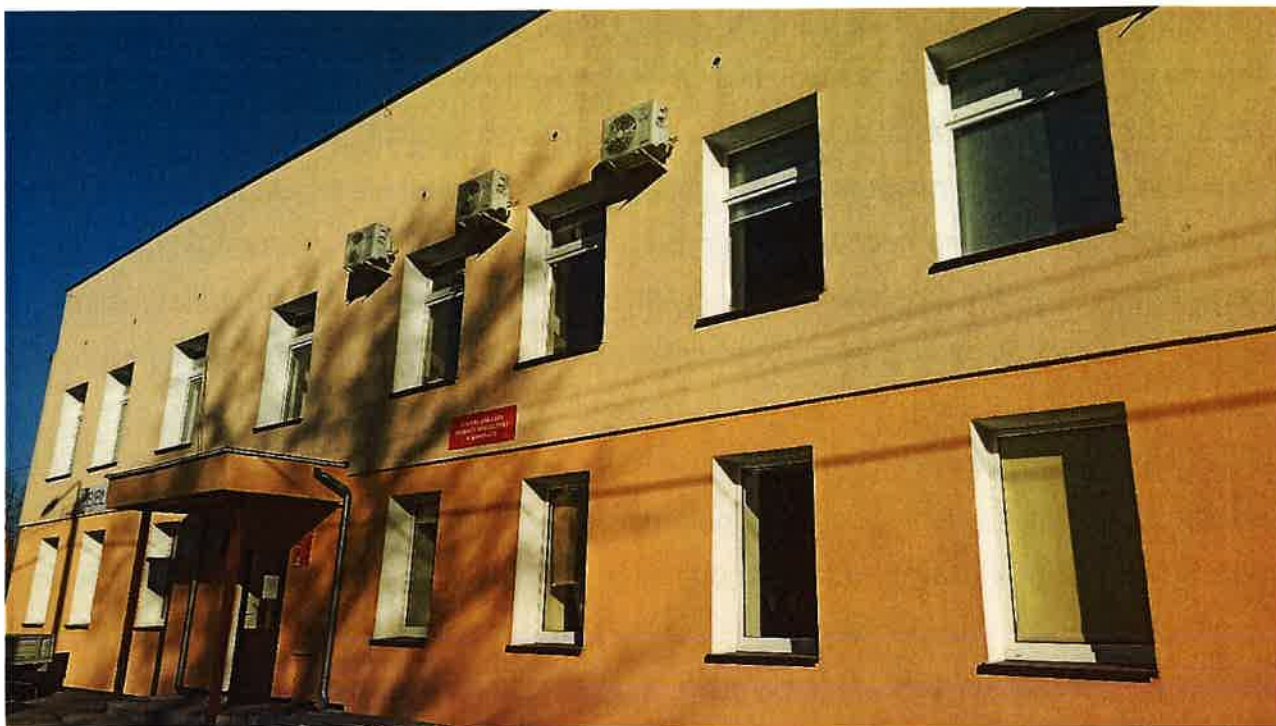
Rys. 8 Budynek będący siedzibą Gminnej Biblioteki Publicznej w Kiwitach oraz świetlicy wiejskiej w Kiwitach