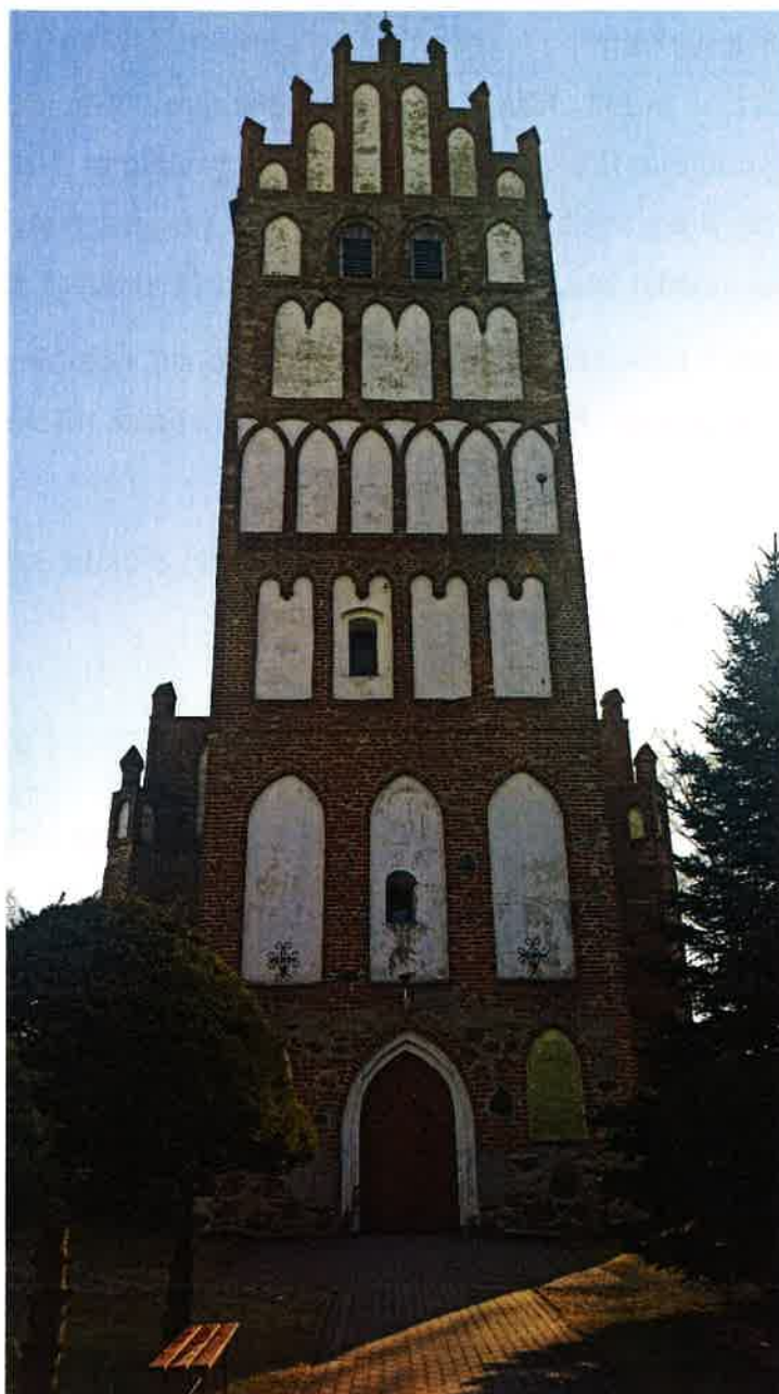
Rys. 7 Kościół pw. Św. Apostołów Piotra i Pawła w Kiwitach