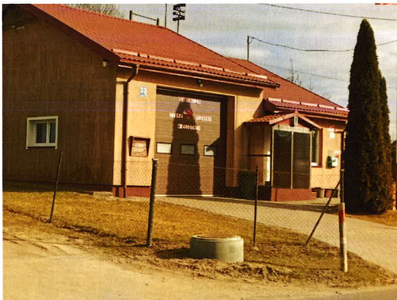
Rys. 7 Ochotnicza Straż Pożarna w Żegotach

Ochotnicza Straż Pożarna w Żegotach funkcjonuje jako stowarzyszenie na podstawie ustawy z dnia 7 kwietnia 1989 r. - Prawo o stowarzyszeniach , ustawy z dnia 24 sierpnia 1991 r. o ochronie przeciwpożarowej. Jednostka OSP Żegoty posiada dobre warunki lokalowe, mieści się w remizie strażackiej z siedzibą Żegoty 33, w której znajduje się boks garażowe wraz z zapleczem socjalnym. Jednostka OSP Żegoty funkcjonuje w Krajowym Systemie Ratowniczo-Gaśniczym. Dysponuje samochodem marki RENAULT PREMIUM zakupionym jako pojazd używany w bardzo dobrym stanie, spełniający wszelkie wymagania. Zakupiony ze środków budżetu gminy w 2017 r.