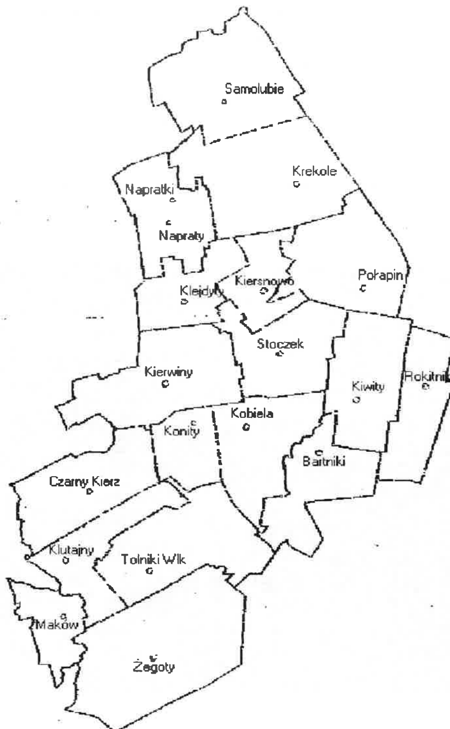
Rys. 5 Położenie sołectwa Żegoty na tle innych sołectw gminy Kiwity.