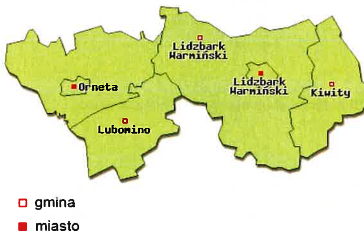
Rys. 3 Gmina Kiwity na tle Powiatu Lidzbarskiego

Powierzchnia terenu obniża się w kierunku północnym. Rzędne powierzchni terenu wynoszą od ok. 80 m n.p.m. w rejonie Samolubia, do 153,6 m n.p.m. w rejonie Bartnik.