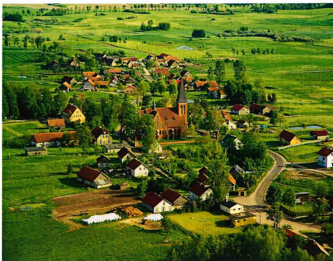
Rys. 6 Panorama miejscowości Żegoty z lotu ptaka

Dominującą przestrzennie jednostką geomorfologiczną, kształtującą krajobraz gminy jest wysoczyzna morenowa o urozmaiconej, na ogół falistej do pagórkowatej rzeźbie.