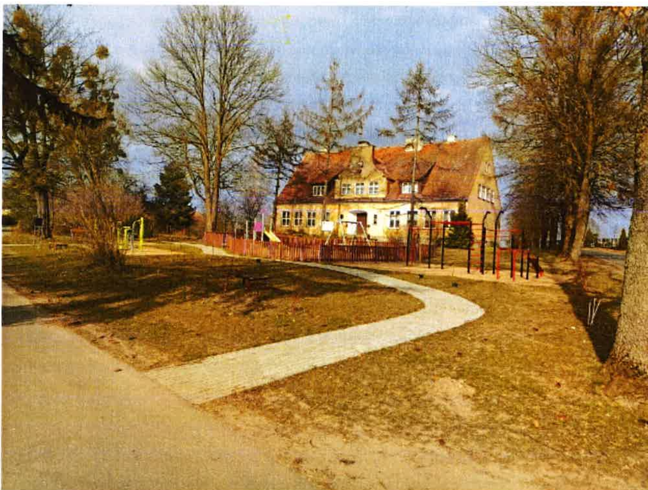
Rys. 8 Centrum rekreacyjne przed budynkiem w którym mieści się punkt biblioteczny w Żegotach

Dzięki zagospodarowaniu tego terenu powstało estetyczne miejsce wypoczynku i rekreacji mieszkańców Żegot.