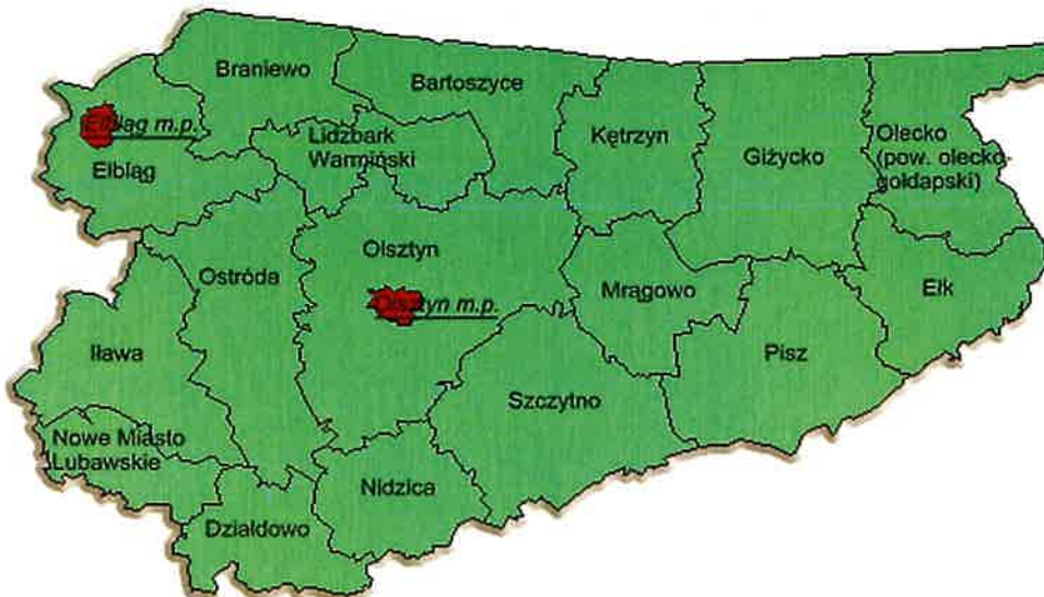
Rys.2 Usytuowanie powiatu lidzbarskiego na tle województwa warmińsko-mazurskiego

Gmina Kiwity położona jest w północno-wschodniej części Polski, w północnej części województwa warmińsko-mazurskiego. Pod względem fizyczno geograficznym obszar gminy Kiwity położony jest na prekambryjskiej platformie wschodnioeuropejskiej w prowincji Niżu Wschodniobałtycko - Białoruskiego w jednostce tektonicznej zwanej syneklizą perybałtycką. Przez obszar gminy przebiega granica dwóch mezoregionów