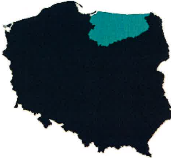
Rys.1 Usytuowanie województwa warmińsko-mazurskiego na tle kraju

Plan Odnowy Miejscowości Żegoty na lata 2022-2028 obejmuje swym zasięgiem miejscowość Żegoty położoną na terenie Gminy Kiwity, w powiecie lidzbarskim, w województwie warmińsko-mazurskim.