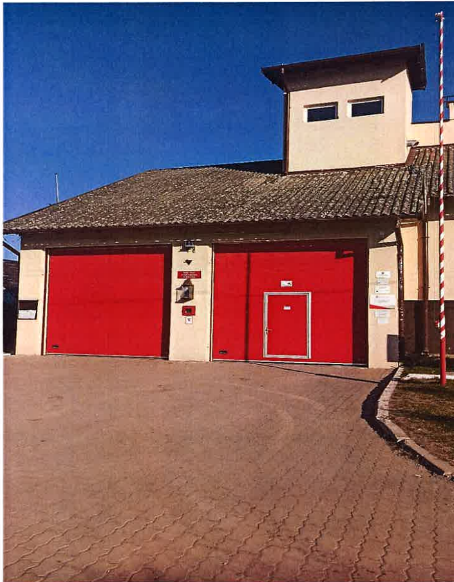
Fot. 7 Remiza Ochotniczej Straży Pożarnej w Kiwitach

wyeksplloatowany i nie spełnia już wymagań zarówno strażaków ochotników jak i norm stawianych przez Krajowy System Ratowniczo-Gaśniczy