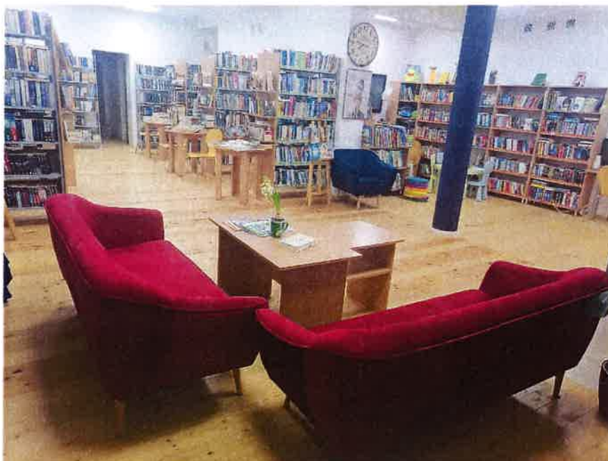
Fot. 3 Wypożyczalnia i czytelnia Gminnej Biblioteki Publicznej w Kiwitach