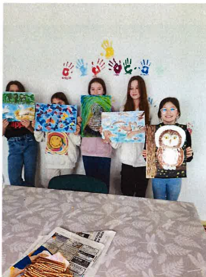
Fot. 6 Uczestnicy koła plastycznego „Plama” prowadzone przez Fundację Opiekun w budynku świetlicy wiejskiej w Kiwitach.