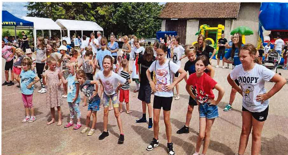
Fot. 4 Festyn „Dzień Rodziny” organizowany w dniu 24 czerwca 2023 r. przez KGW „Zocha” w Kiwitach