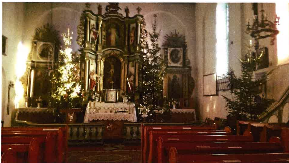
Fot. 2 Wnętrze Kościoła pw. Św. Apostołów Piotra i Pawła w Kiwitach