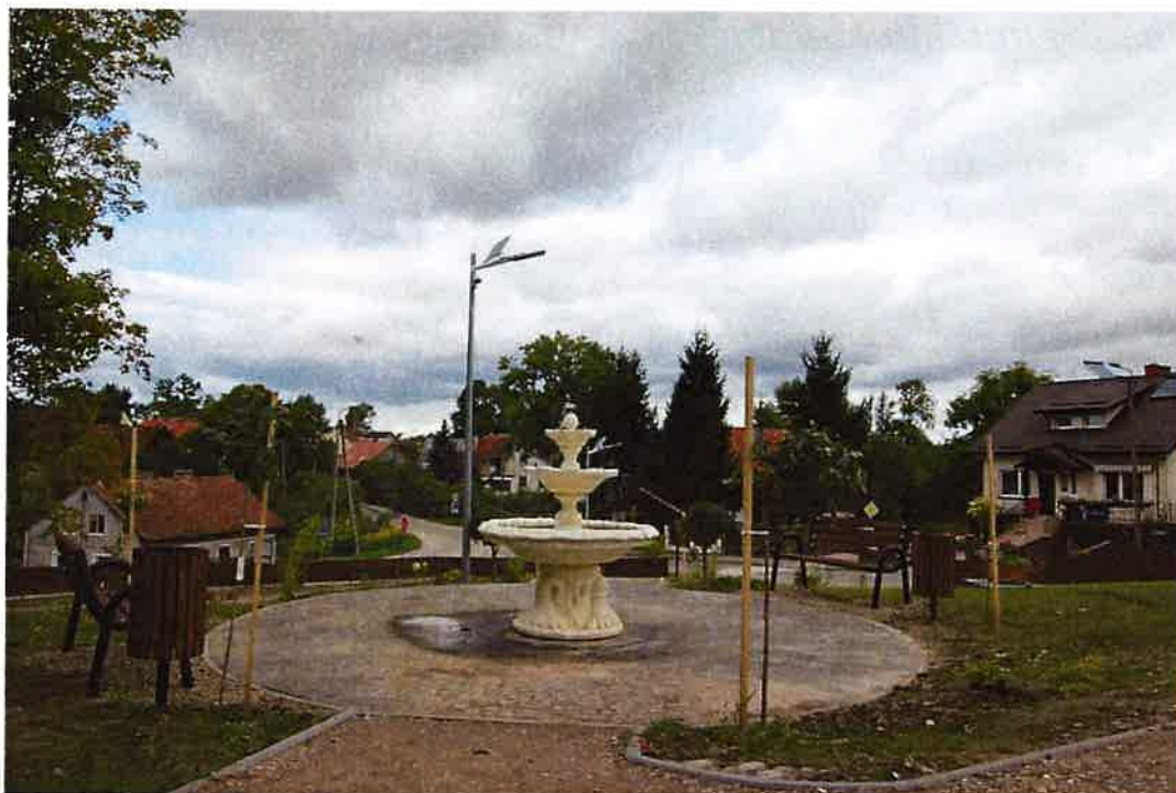
Fot. 8 Park rekreacyjny w Kiwitach

również siłownia zewnętrzna. Dzięki zagospodarowaniu tego terenu powstało estetyczne miejsce wypoczynku i rekreacji mieszkańców Kiwit.