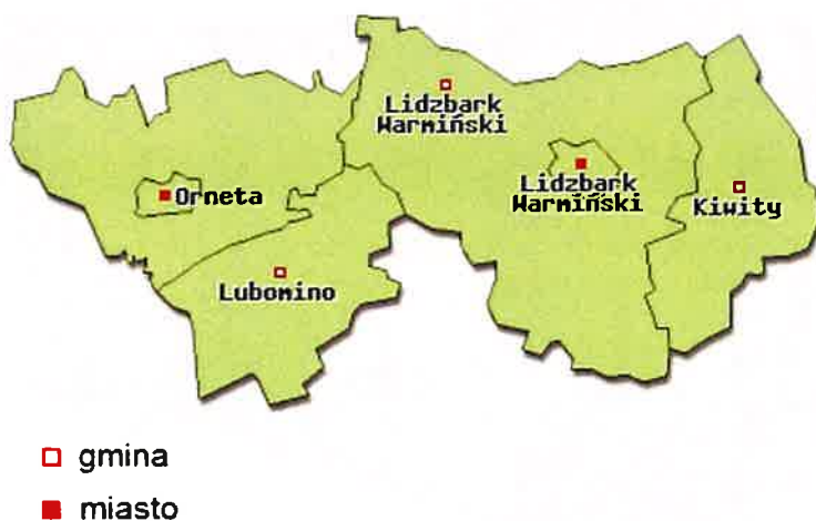
Rys. 3 Gmina Kiwity na tle Powiatu Lidzbarskiego

Powierzchnia terenu obniża się w kierunku północnym. Rzędne powierzchni terenu wynoszą od ok. 80 m n.p.m. w rejonie Samolubia, do 153,6 m n.p.m. w rejonie Bartnik.