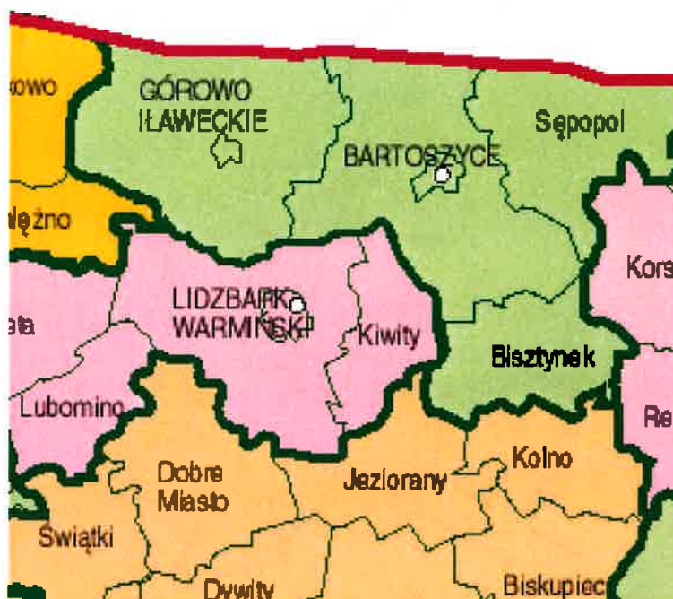
Rys. 4 Położenie Gminy Kiwity na tle innych gminy województwa warmińsko-mazurskiego

Powierzchnia gminy wynosi 14,5tys. ha. Na dzień 31 grudnia 2023r. zamieszkiwało ją 3103 mieszkańców.