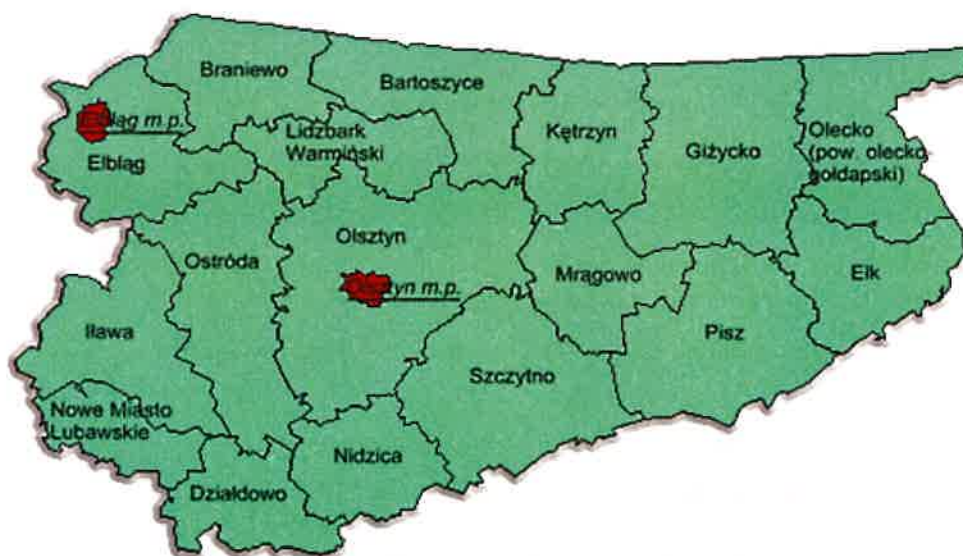
Rys.2 Usytuowanie powiatu lidzbarskiego na tle województwa warmińsko-mazurskiego