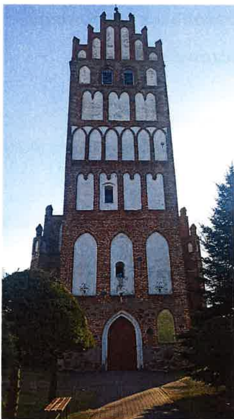
Fot.1 Wieża Kościoła pw. Św. Apostołów Piotra i Pawła w Kiwitach