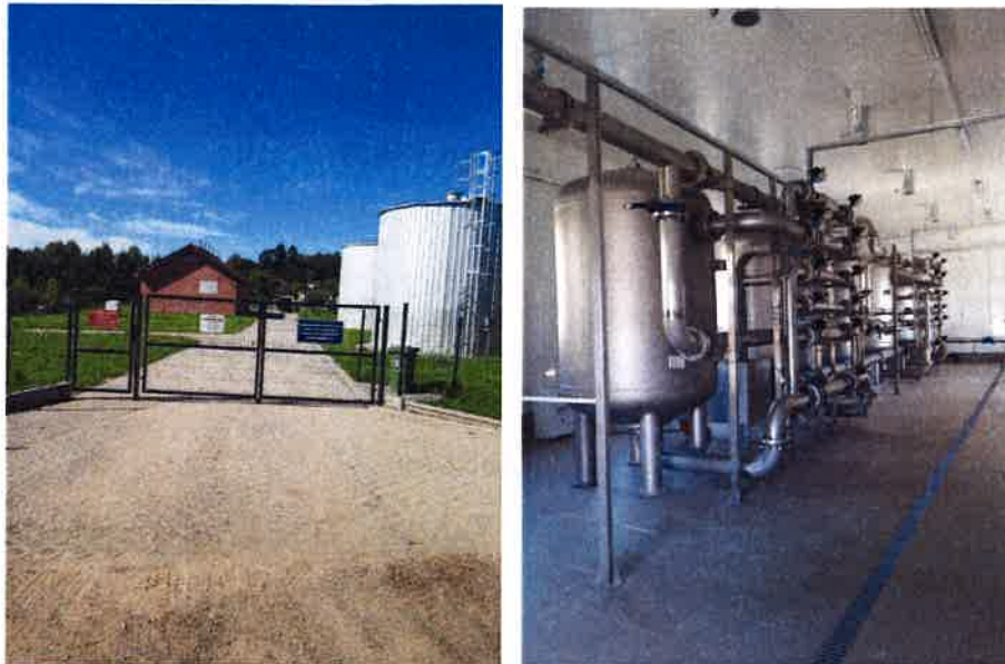
Fot. 9, 10 Stacja Uzdatniania Wody w Kiwitach – widok z zewnątrz i wewnątrz stacji.