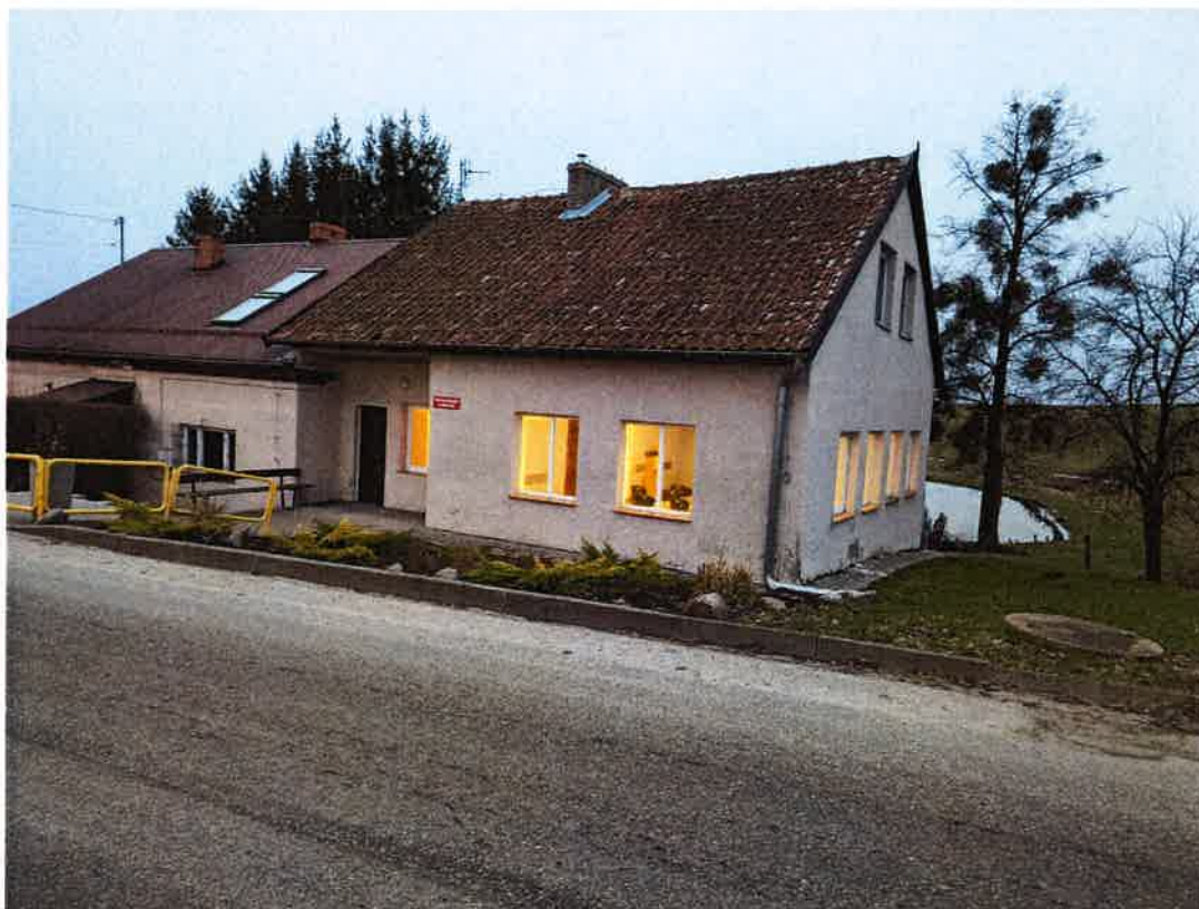
Fot. 3 Budynek świetlicy wiejskiej w Krekolach