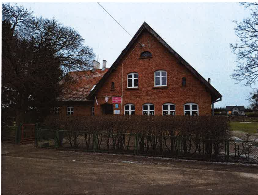
Fot. 2 Budynek Niepublicznej Szkoły Podstawowej w Krekolach