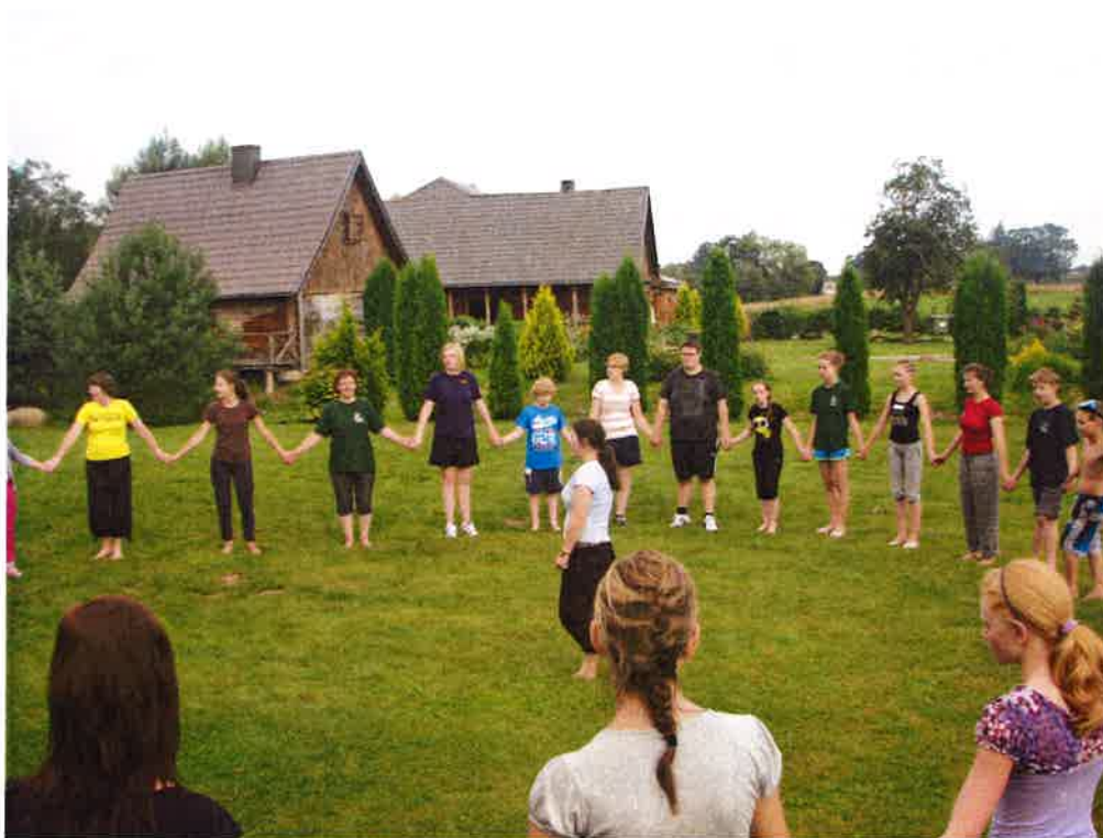
Fot. 6 Jedne z zajęć organizowanych przez Stowarzyszenie „Łańcuch Wzajemności”

W 2020 r. stowarzyszenie rozpoczęło współpracę ze Związkiem Polaków na Litwie, Oddział w Wędziagołach. W 2017 roku Stowarzyszenie za prowadzoną działalność zostało wyróżnione przez Kapitułę Nagrody do udziału w finałowej Gali II edycji nagrody Prezydenta RP „Dla Dobra Wspólnego”.