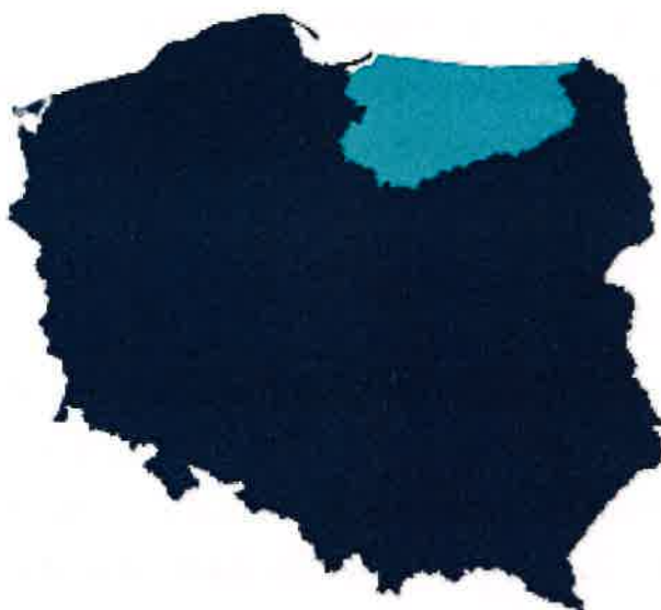
Rys.1 Usytuowanie województwa warmińsko-mazurskiego na tle kraju

Koncepcja inteligentnej wsi dla miejscowości Krekole obejmuje swym zasięgiem miejscowość Krekole położoną na terenie Gminy Kiwity, w powiecie lidzbarskim, w województwie warmińsko-mazurskim.