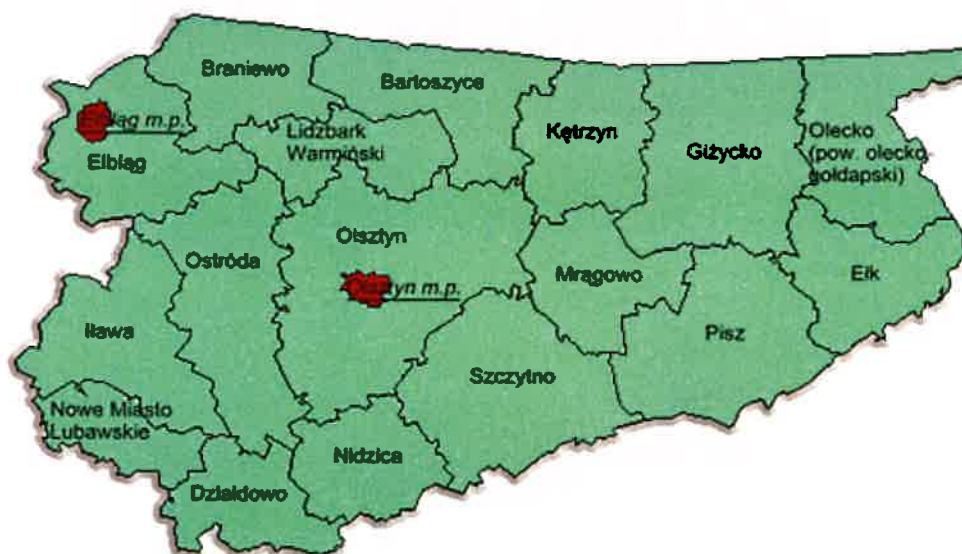
Rys.2 Usytuowanie powiatu lidzbarskiego na tle województwa warmińsko-mazurskiego Gmina Kiwity położona jest w północno-wschodniej części Polski, w północnej części