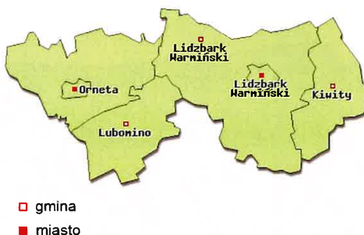
Rys. 3 Gmina Kiwity na tle Powiatu Lidzbarskiego

Powierzchnia terenu obniża się w kierunku północnym. Rzędne powierzchni terenu wynoszą od ok. 80 m n.p.m. w rejonie Samolubia, do 153,6 m n.p.m. w rejonie Bartnik.