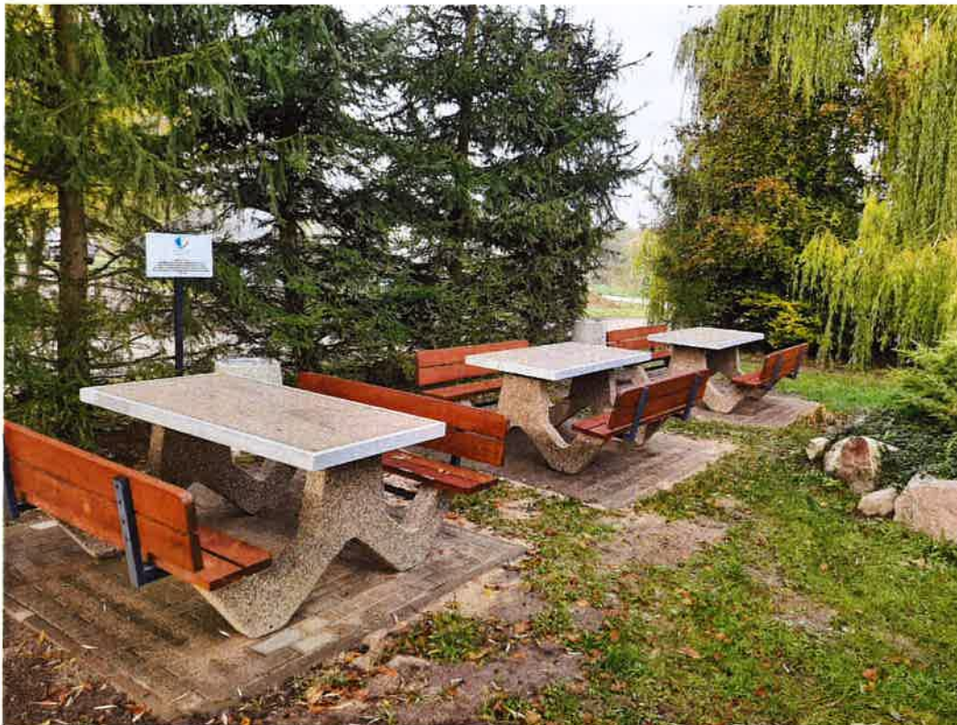
Fot. 4 Skwer rekreacyjny tzw. trójkąt w Krekolach