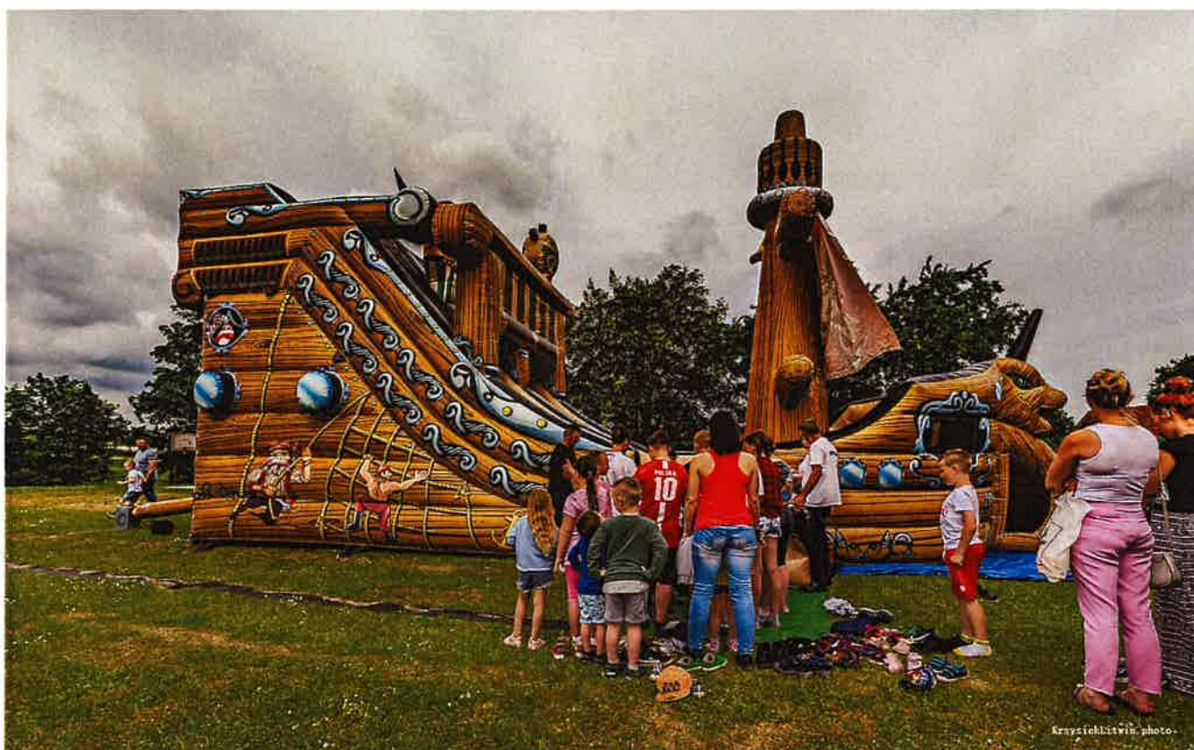
Fot. 5 Festyn z okazji Dnia Dziecka organizowany przy NSP w Krekolach.

Fundacja organizuje cyklicznie festyn z okazji Dnia Dziecka przy Niepublicznej Szkole Podstawowej w Krekolach. Festyn kierowany jest przede wszystkim do społeczność Krekol i okolicznych miejscowości. Impreza jest otwarta i mogą w niej wziąć udział wszyscy mieszkańcy Gminy Kiwity i gmin ościennych. Realizacja tych festynów możliwa była dzięki dotacji otrzymanej w konkursie przeprowadzonym przez Urząd Gminy w Kiwitach.