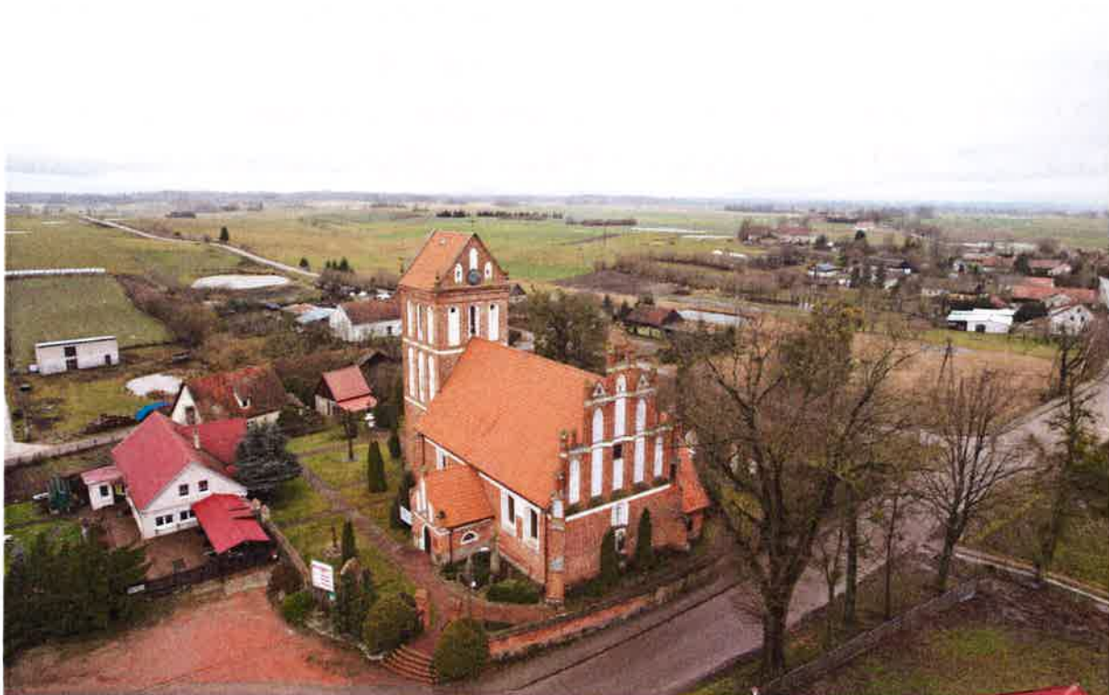
Fot. 1 Kościół pw. Świętego Krzyża i Św. Wawrzyńca w Krekolach