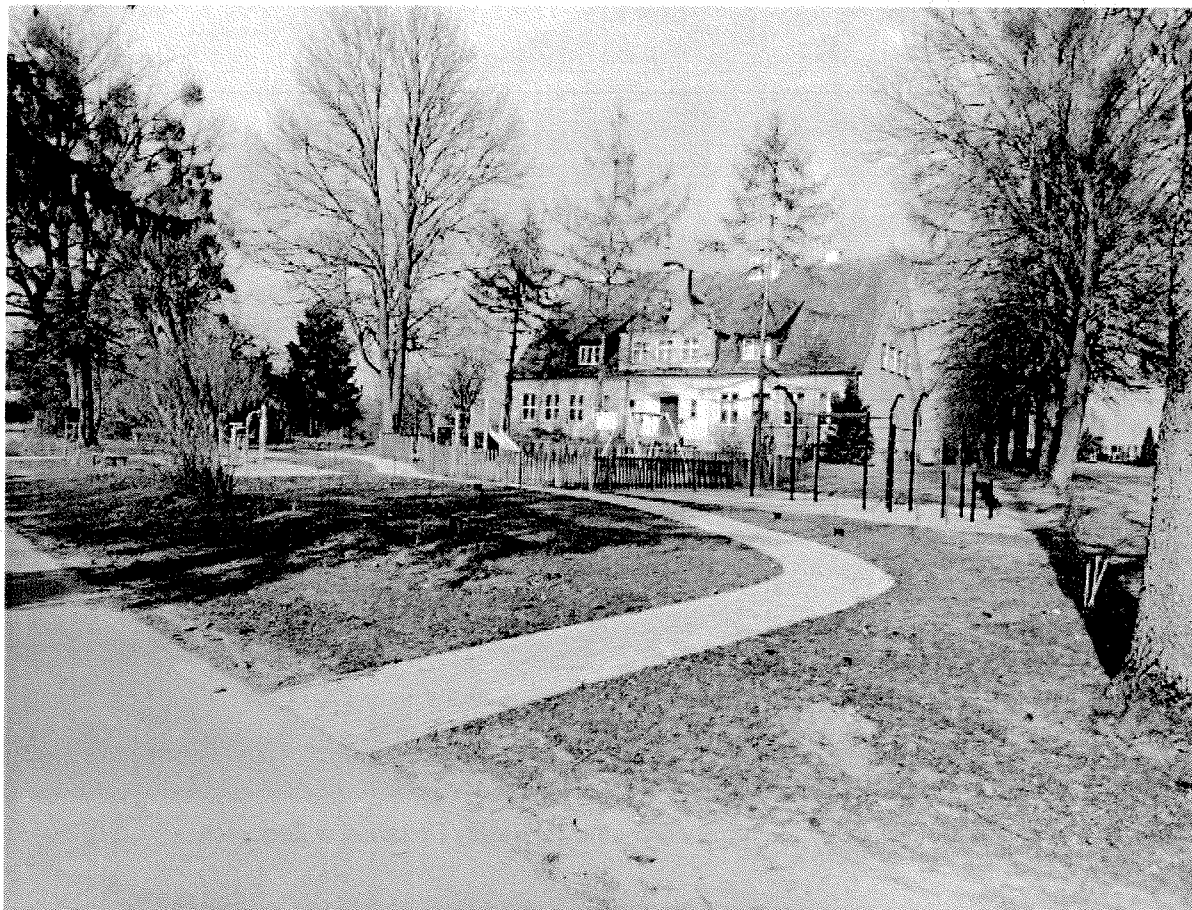
Fot. 18 Centrum rekreacyjne przed budynkiem w którym mieści się punkt biblioteczny w Żegotach